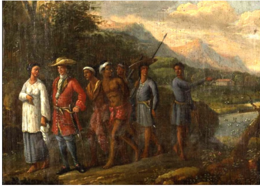
'Hollandse koopman met slaven in heuvellandschap' (anoniem)